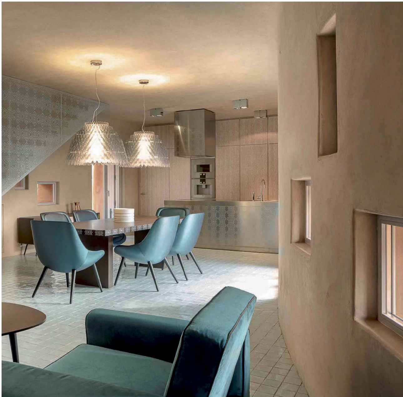
SOPRA: L'INTERNO DI VILLA PALAS. INTORNO AL TAVOLO DA PRANZO SEI POLTRONCINE. IN PRIMO PIANO TAVOLINI E POLTRONA (TUTTO MOROSO). DUE LAMPADARI HALF CHARLOTTE SUSPENSION (SLAMP), ISOLA CUCINA AREX (XERA), CUCINA E ACCESSORI GAGGENAU.

200 ai 500 metri quadrati e sono concepite in quattro diverse tipologie. Gli interni, firmati da Doriana, moglie di Fuksas, si ispirano all'artigianato sardo: Sa Palas è il corpetto di panno e fili d'oro che le donne sarde indossano nei giorni di festa e Villa Palas è infatti il nome di una delle quattro varianti. Le altre sono Villa Luxi, in sardo "luce", Villa Nea, "alba", e Villa Arenada, in onore al melograno. Tutte hanno un giardino privato, una piscina e un terrazzo sul tetto. Sinuose, come modellate dal vento, sono arredate con i mobili disegnati da Doriana Fuksas e nell'interior mantengono il nitore e l'essenzialità degli esterni.